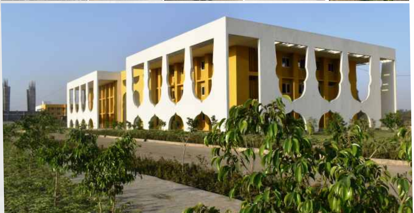
Upcoming Campus of University in Bisankhedi