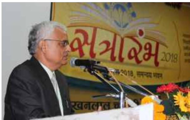
Shri OP Rawat, Ex. Chief Election Commissioner