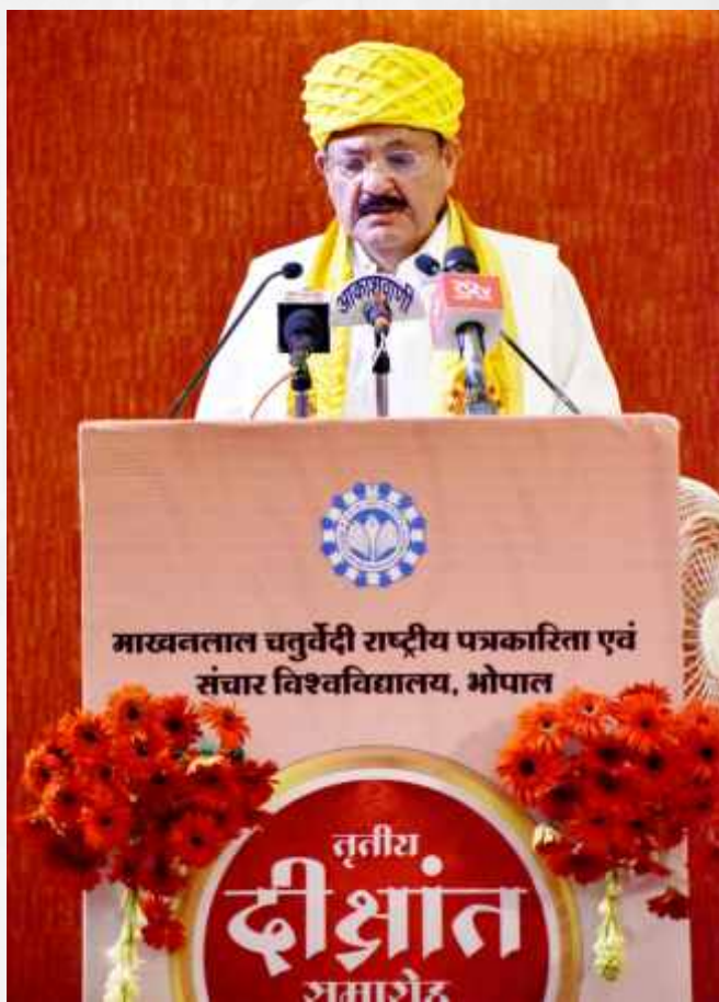
Shri Venkaiah Naidu

Vice President of India, the Visitor of University