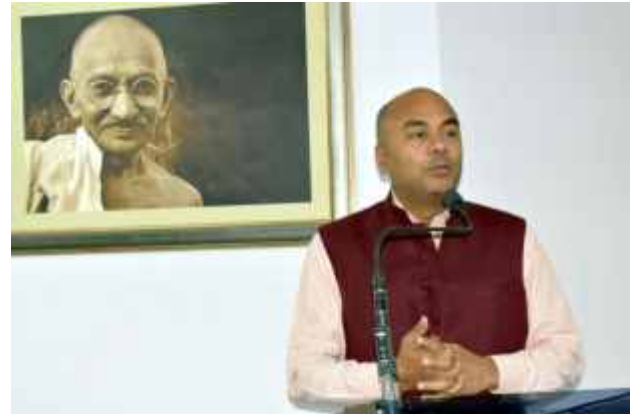
श्री भूपेंद्र चौबे, संपादक सीएनएन न्यूज 18