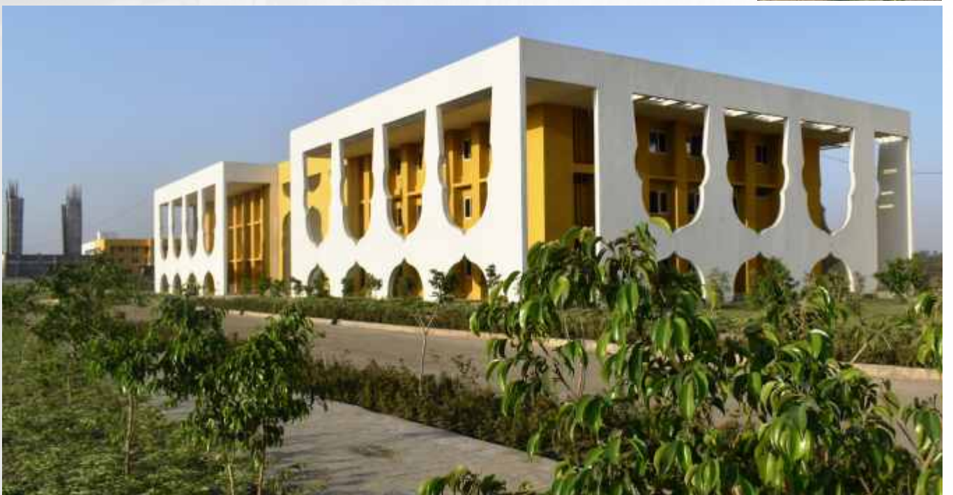
बिशनखेड़ी में लगभग तैयार विश्वविद्यालय का नया परिसर