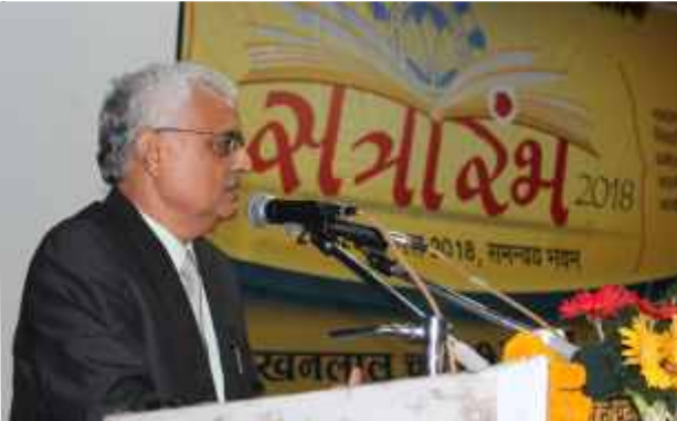
श्री ओपी रावत, पूर्व मुख्य चुनाव आयुक्त