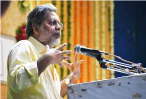
श्री पुण्य प्रसून बाजपेयी, वरिष्ठ पत्रकार