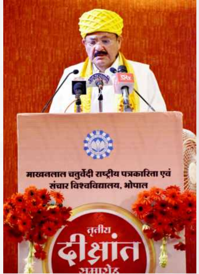
श्री वेंकैया नायडू

भारत के उपराष्ट्रपति, विश्वविद्यालय के कुलाध्यक्ष