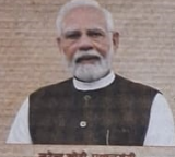
नरेंद्र मोदी, प्रधानमंत्री