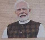
नरेंद्र मोदी, प्रधानमंत्री