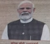
श्री. नरेंद्र मोदी, प्रधानमंत्री