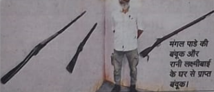
मंगल पांडे की बंदूक और रानी लक्ष्मीबाई के धर से प्राप्त बंदूक।